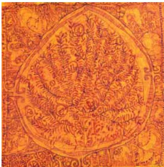
فرشته محسنی، بدون عنوان، ۱۵۰×۱۵۰، ترکیب مواد و دوخت و دوز روی بوم