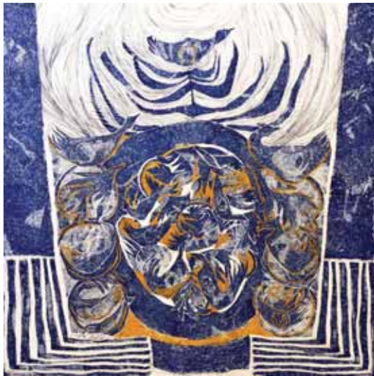
ندا غیوری، بدون عنوان، ۱۵۰×۱۵۰، ترکیب مواد و دوخت و دوز روی بوم