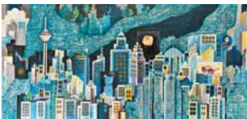
بهناز جلالی، مهتاب، ۷۰×۱۵۰، ترکیب مواد روی بوم