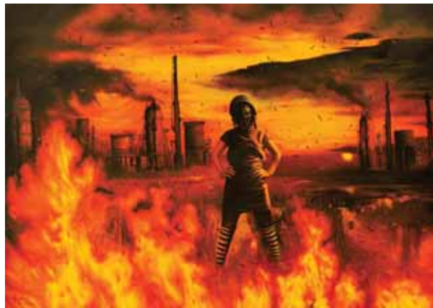
حمزه فرهادی، از مجموعه نفت، ۱۴۰×۱۸۰، رنگ روغن روی بوم