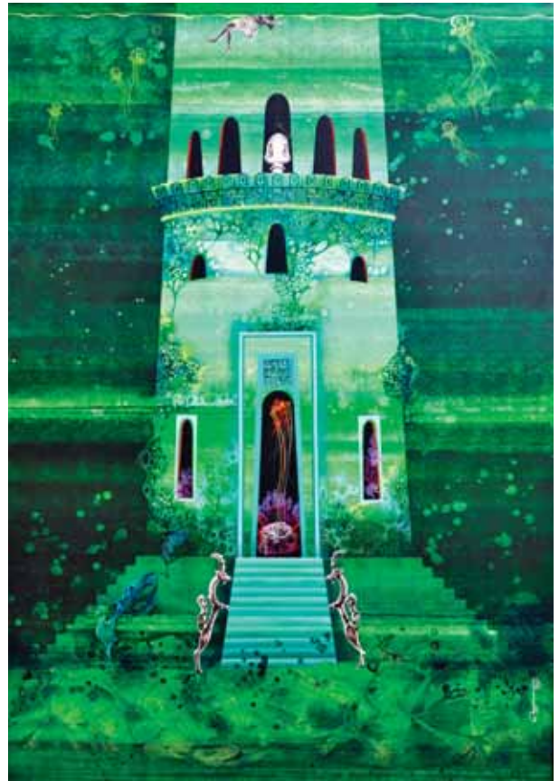
شیمای خشکخاشی، خواب کهن، ۲۰۰×۱۴۰، اکریلیک روی بوم