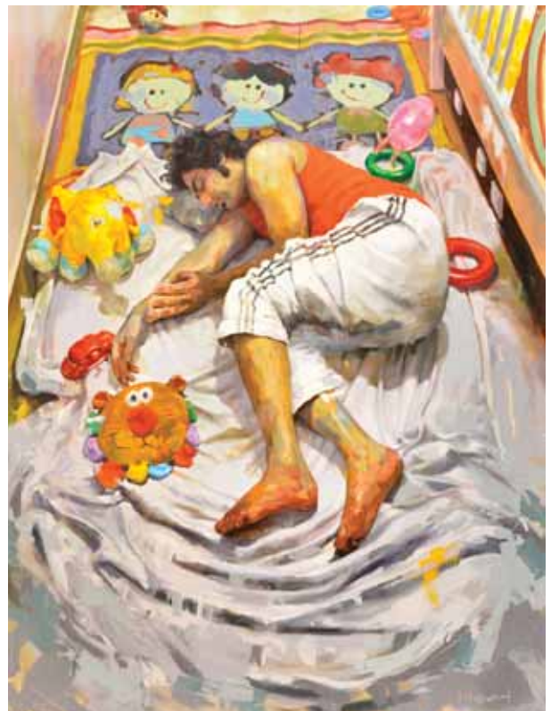
ابوحمید اسدی، زندگی من، ۱۸۰×۱۴۰، اکریلیک روی بوم