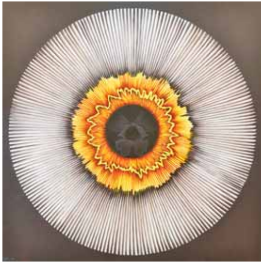
مژده اتراک، گیجی، ۲۰۰×۲۰۰، رنگ روغن روی بوم