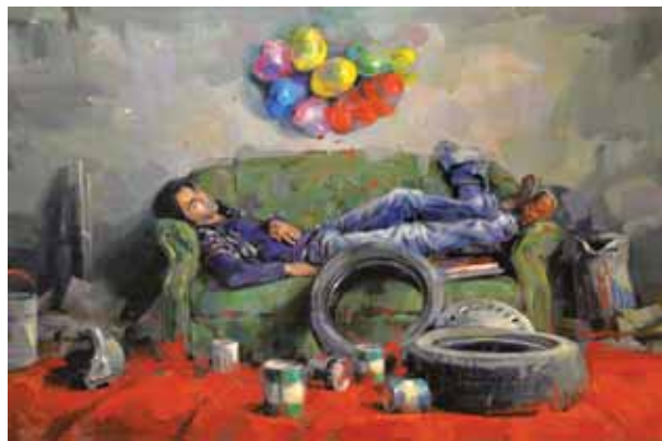
ابوسعید اسدی، خواب اشیا، ۱۳۵×۲۰۵، اکریلیک روی بوم