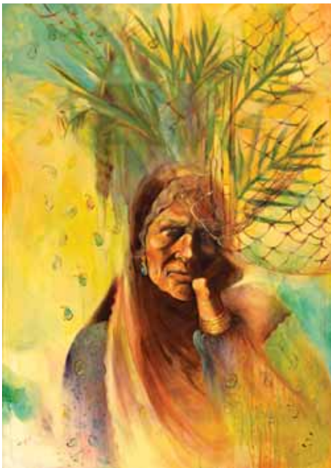
حکیمه بحرانی پور، نخل، ۱۴۰×۱۱۰، اکریلیک روی بوم