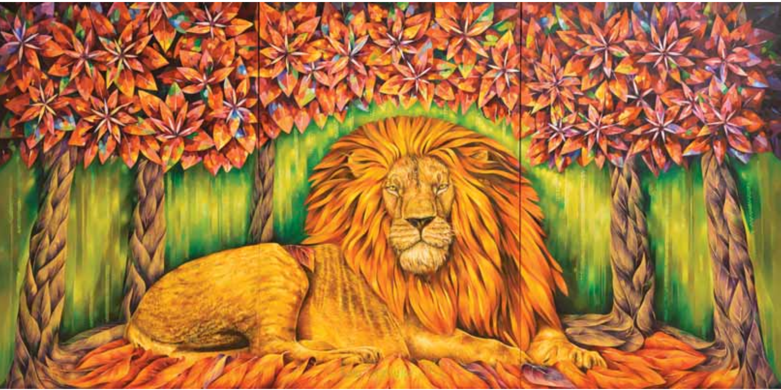
سارا سهیلی فر، ایران، ۱۵۰×۳۰۰، رنگ روغن روی بوم